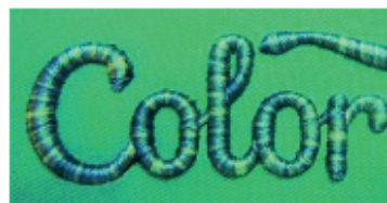
3D-Stickerei mit Bodybuilder und Multicolor Garn