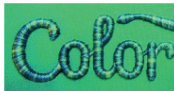
3D embroidery with Bodybuilder and multicolour thread